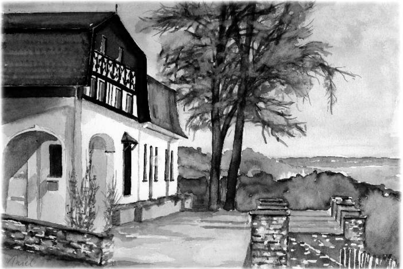
Wittersheim - Kulturlandschaftszentrum „Haus Lochfeld“, gemalt von Peter Johannes Thiel